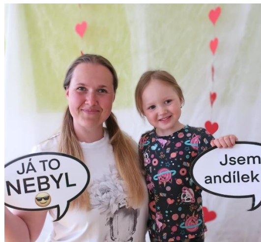
„Wellnes day“ pro maminky v MŠ