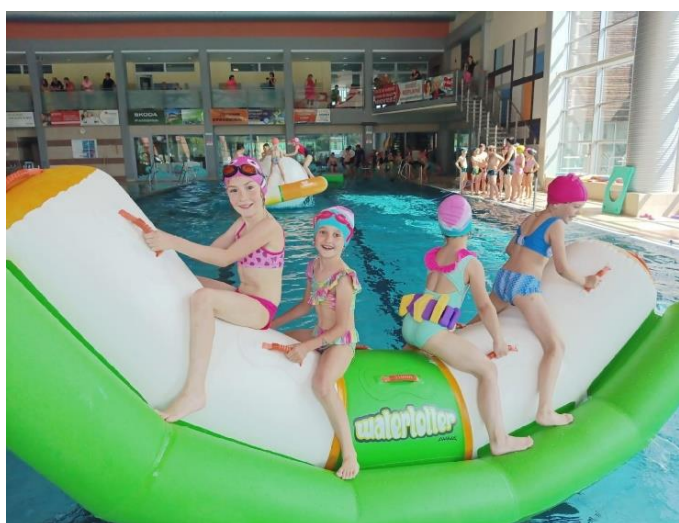
Plavání - Hranice

V tomto čtvrtletí jsme se zúčastnili několika soutěží: