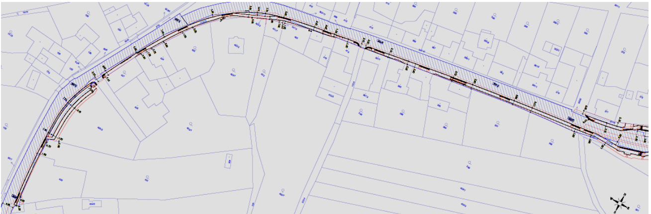
Koordinační situace „Novostavby chodníků v obci Choryně“ – 1. část

Zároveň připravujeme žádost o dotaci na výstavbu nových chodníků v lokalitě Kutíky , které zajistí větší bezpečnost pro chodce v obci, zejména děti a seniory. Víme, že bezpečný pohyb po obci je pro nás všechny důležitý a pracujeme na tom, aby se tento projekt mohl co nejdříve realizovat. Současně se i rozběhne stavební povolení pro tuto akci.