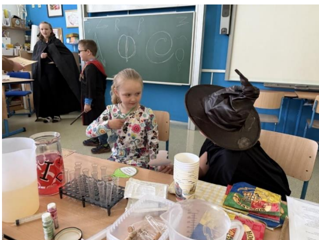
Zápis do 1. třídy

Na jaře jsme ve škole, společně s rodiči, oslavili „Den Země“. Pro všechny zde byla připravena stanoviště se zvířaty a tvořivé dílničky. Akce proběhla v rámci projektu „Kamarádi na statku“, který byl spolufinancován Zlínským krajem.