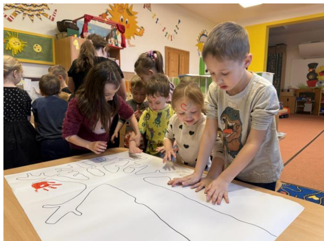
„Den naruby“ v MŠ