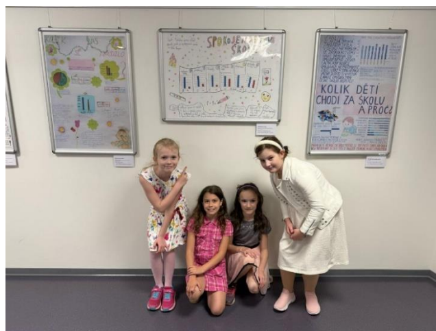
ČSÚ Praha – „statistický plakát“

V měsíci dubnu se uskutečnil zápis do základní školy. Pro příští školní rok bylo do 1. ročníku přijato 13 dětí. Zápis jsme zaměřili na „Školu čar a kouzel“ a věříme, že jsme s Harrym a jeho kamarády (v podání žáků 3. – 5. ročníku) předškoláky namotivovali na vstup do školy!