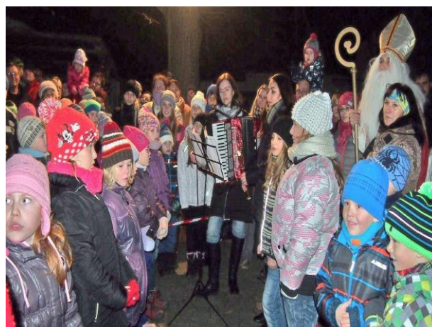
Rozsvěcování vánočního stromu

Zúčastnili jsme se také několika dalších soutěží: