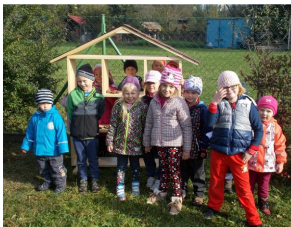
Hmyzí domeček (výroba Stolařství Vaněk)