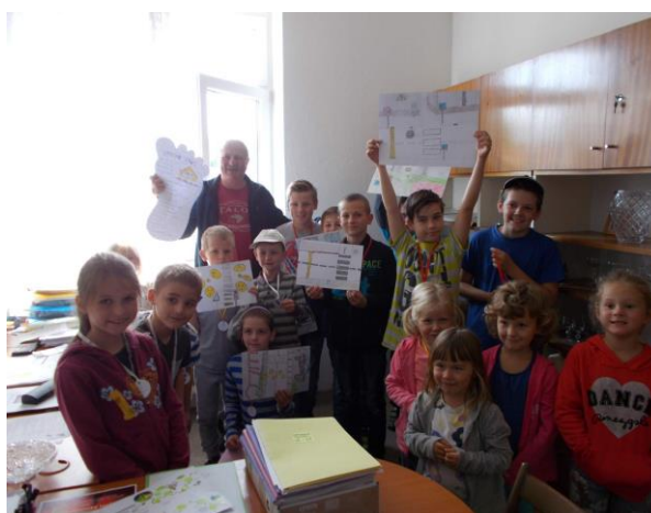
S projektem u pana starosty

V měsíci říjnu jsme oslavili „ DEN STROMŮ “ v rámci projektu 72 hodin. 14. října v prostorách školy proběhl výukový program s liškou, kdy se žáci dozvěděli řadu zajímavostí o této šelmě a také si mohli ochočené lišce zblízka prohlédnout i pohladit. Venku na zahradě jsme zasadili dva ovocné stromy a shlédli ukázkou dravců. Na závěr jsme si společně vyrobili hmyzí domeček.