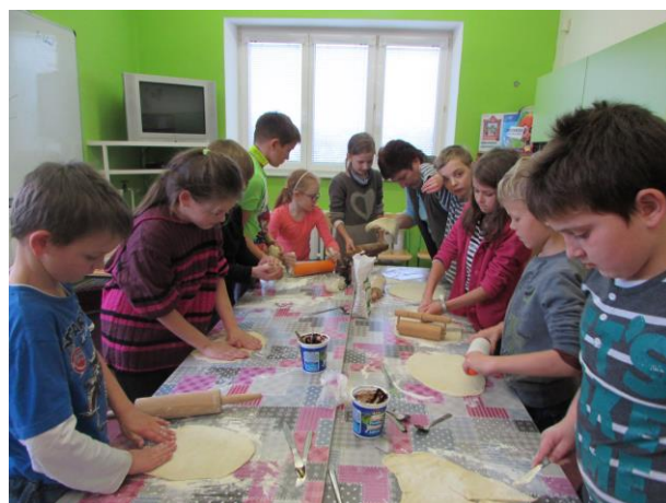
Pečení martinských rohlíčků ve šd

V tomto měsíci - prosinci - patří mezi nejatraktivnější akce „ ROZSVĚCOVÁNÍ VÁNOČNÍHO STROMU “ před kulturním domem, kde děti vystupovaly, dále předvánoční spaní ve škole letos na téma „ ČESKÉ HVĚZDY “ a také „ ADVENTNÍ KONCERT “ v choryňském kostele 19.12.