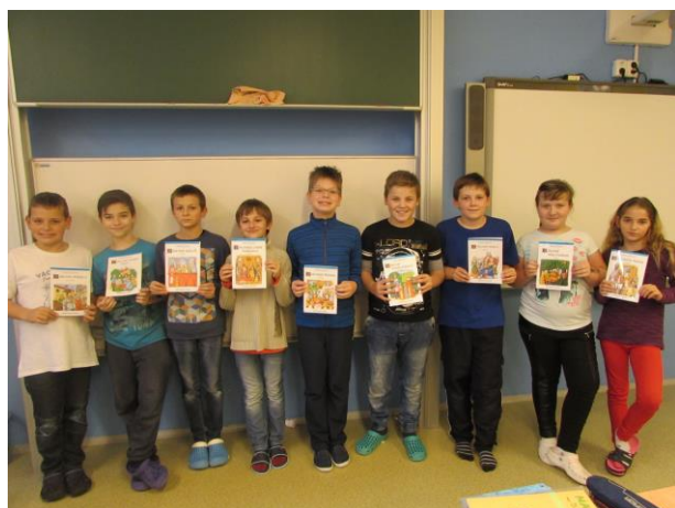
Výhra „kde je to, co je to?“

V tomto měsíci - prosinci - patří mezi nejatraktivnější akce „ ROZSVĚCOVÁNÍ VÁNOČNÍHO STROMU “ před kulturním domem, kde děti vystupovaly, dále předvánoční spaní ve škole letos na téma „ ČESKÉ HVĚZDY “ a také „ ADVENTNÍ KONCERT “ v choryňském kostele 19.12.