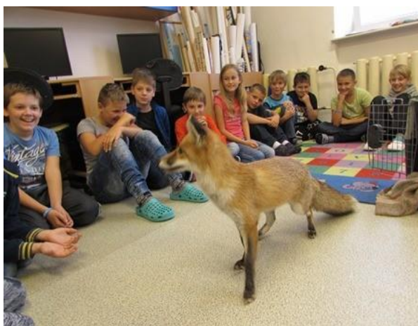
Program s liškou

V měsíci říjnu jsme oslavili „ DEN STROMŮ “ v rámci projektu 72 hodin. 14. října v prostorách školy proběhl výukový program s liškou, kdy se žáci dozvěděli řadu zajímavostí o této šelmě a také si mohli ochočené lišce zblízka prohlédnout i pohladit. Venku na zahradě jsme zasadili dva ovocné stromy a shlédli ukázkou dravců. Na závěr jsme si společně vyrobili hmyzí domeček.