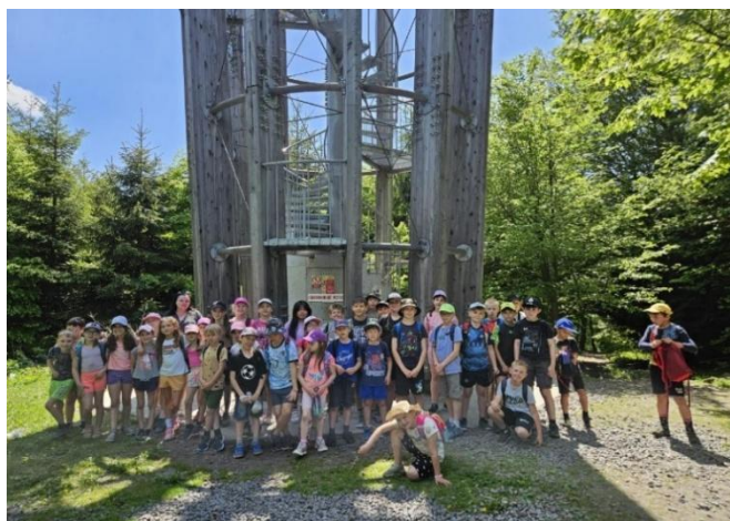
Škola v přírodě

V dubnu jsme oslavili „Den Země“. Pro všechny byl připraven bohatý program: vystoupení sokolnické skupiny NYCTEA, mobilní planetárium, přírodovědné pokusy, tvořivá dílna a závěrečné společné posezení s opékáním špekáčků.