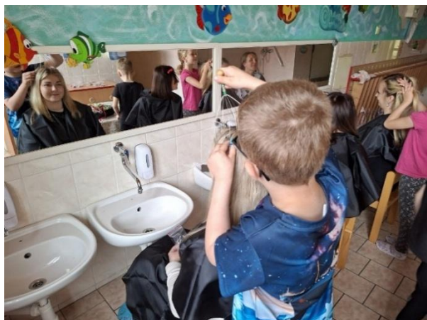
Wellness pro maminky v MŠ

V dubnu proběhl zápis dětí do mateřské školy pro příští školní rok, ke kterému se dostavilo 15 dětí.