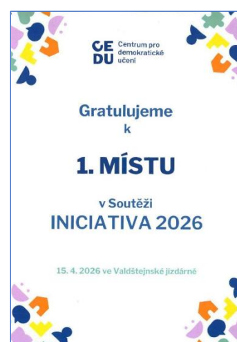
„Soutěž Iniciativa 2026“