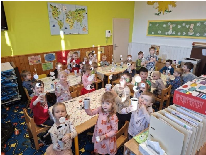
Tvoření se Zahradním centrem (výhra MŠ)

Žáci 4. a 5. ročníku se zúčastnili matematické soutěže PANGEA, výsledky ještě neznáme. V rámci RECYKLOHRANÍ jsme se zapojili do soutěžních úkolů „Recyklační zpravodaj“ a „Tiskařská dílna“.