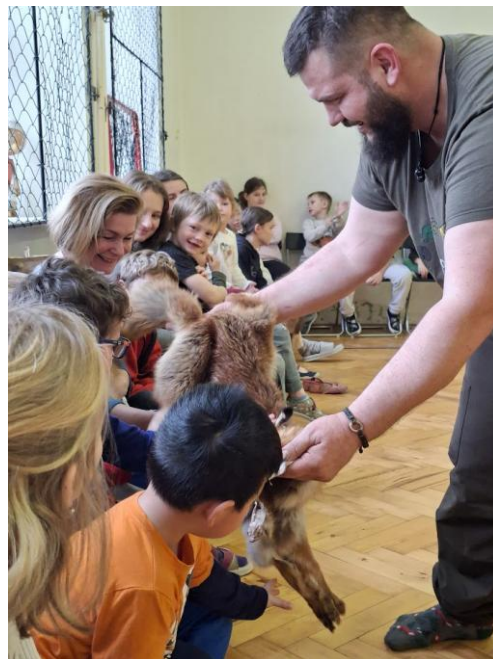
Program s liškou