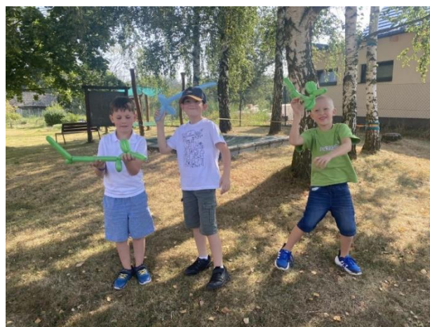
Zábavný program s klaunem