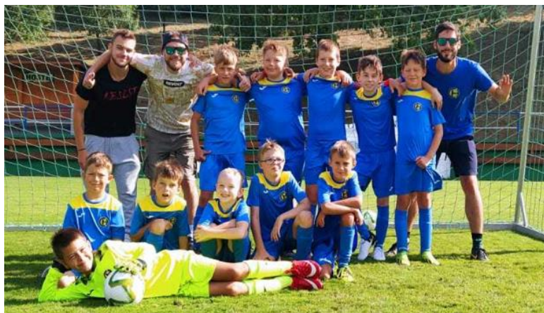
Tým školičky (vlevo) a starší přípravky (vpravo).