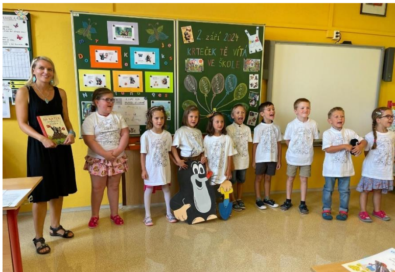
Slavnostní zahájení školního roku 2024/2025