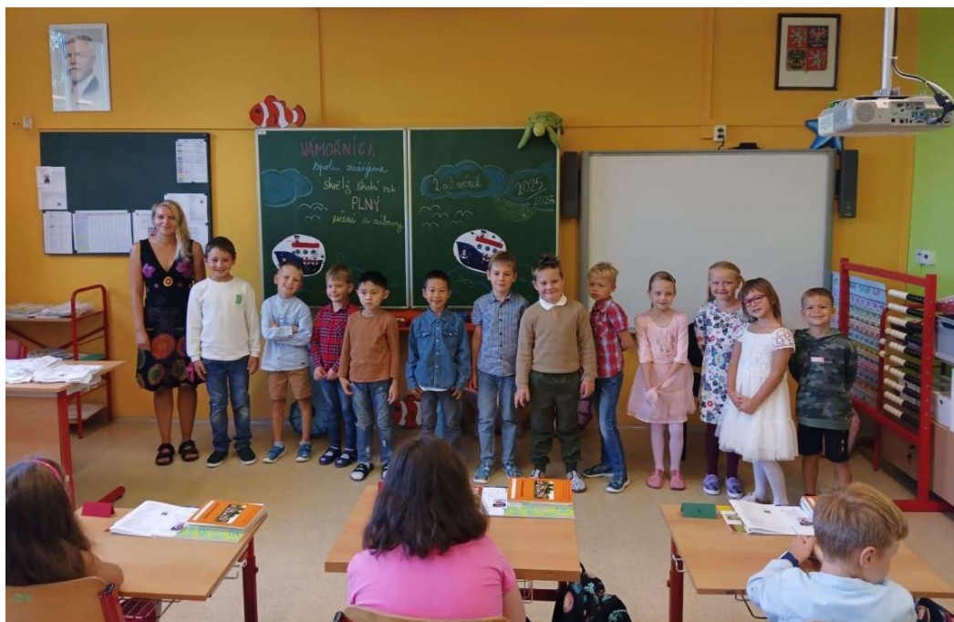
Slavnostní zahájení školního roku 2025/2026 – 1. ročník ZŠ