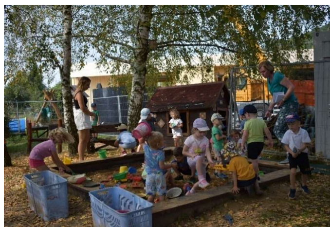
První týden v MŠ